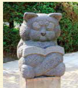
① 「本を読むネコ」 せき たかゆき 関孝行

私は夏は木かげで、冬は日なたで一日中本を読んでいきたいのです。とりあえずは、このネコに私の代わりに本を読んでいてもらいます。