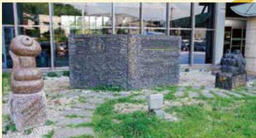
⑥ 「田園ふあんたい」 みやうちじゅんきち せき たかゆき 宮内淳吉、関孝行