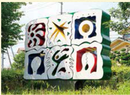
④ 「このまちはぼくたちのもの」 We own this town わたなべとよしげ 渡辺豊重

公園や遊歩道に設置されることが多い屋外彫刻ですが、市ケ尾の彫刻群は住宅地や街の中にも設置されていて、日常の景色の中に異空間をつくり出していることが特徴です。人や猫、魚などの姿をした親しみやすい作品や、空想の物語や鳴り響く音楽のイメージと結びついている作品が多いことがこの彫刻群の大きな魅力となっています。