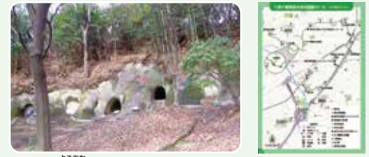
市ヶ尾横穴墓群

富士山や大山を望む眺望の良い古墳や遺跡を巡り、古代の首長たちに想いを馳せながら歩いてみましょう。