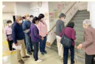
ガイドボランティア養成講座の様子

障害のある人が外出する際に、目的地まで同行することで、移動の支援をするボランティアです。通学・通所の行き帰りなどを支援する人を募集しています。特別な資格は不要です。上記相談窓口へ気軽にお問い合わせください。 活動には奨励金が支払われます ガイドボランティア養成講座や障害者理解講座を開催しています コーディネーターがマッチングから活動開始、その後のサポートまで付き添うので安心です