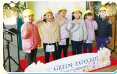
区役所で開催したイベント

花・緑・農等、青葉区が誇るさまざまな特色を生かし、GREEN×EXPO 2027の機運醸成を図ります。