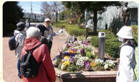
青葉区制30周年記念ウォーキングツアー

「未来へつなごう 青葉の魅力」をキャッチフレーズに区制30周年を記念したさまざまな企画事業を通じて、愛着を持てるまちを目指します。あわせて、花・緑・農等、青葉区が誇るさまざまな特色を生かしGREEN×EXPO 2027の機運醸成を図ります。