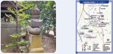
五輪塔形式の庚申塔

田園風景が残る田奈。大山街道の周辺に点在する石造物や寺社。歴史の息吹を身近に感じてみませんか？