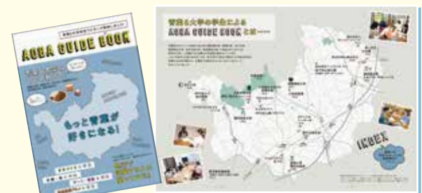
青葉6大学連携事業で作成したガイドブック

区内事業者や大学などとの連携や、区の特性にあわせたデータの収集・分析等を行い、地域課題の解決に取り組むことで、利便性が高く魅力あふれる選ばれるまちを実現します。