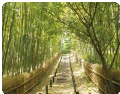
愛護会が作った樹林内の竹垣

樹林の管理、植物の保護・育成、清掃や草刈りを行うボランティア団体で約30人の会員がいます。また、毎年秋のイベントの開催や、地元小学校の自然観察学習のサポートなど、地域に根差した活動も精力的に行っています。その功績がたたえられ、昨年、「みどりの愛護」功労者国土交通大臣賞を受賞しました。