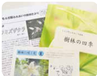
本格的な植物調査を載せた広報誌