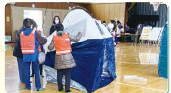
避難所環境の充実

災害や事故をはじめ、さまざまなリスクに備えるとともに、脱炭素化の取組を進めることで、将来の世代にわたって安全で安心して暮らせるまちづくりを進めます。