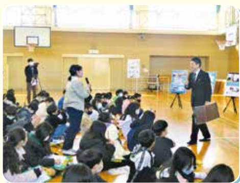
学校法人桐蔭学園との連携により試行実施した環境出前授業の様子