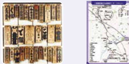
荏田宿まねき看板

かつての宿場町だった荏田、旧道が残る市ヶ尾。昔にタイムスリップして、大山詣での旅人気分歩いてみましょう。