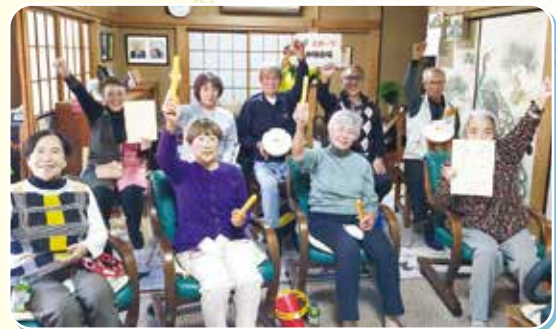
eスポーツを活用した高齢者の社会参加促進

誰もが自分らしく健やかに暮らすことができるよう、地域での支え合いを支援します。また、いくつになっても生きがいや役割を持って、支え合い、活躍できるよう取組を進めます。