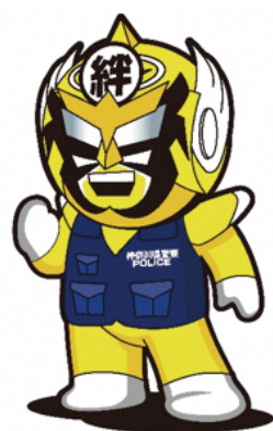
「絆」大使 振り込まセンジャー