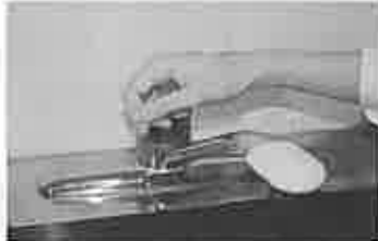
7. 水道の栓を止めるときは、手首が肘で止める。できないときは、ペーパータオルを使用して止める