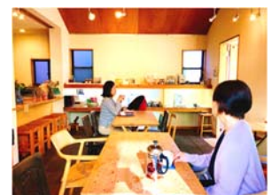
港北区NPO法人街カフェ大倉山ミエール