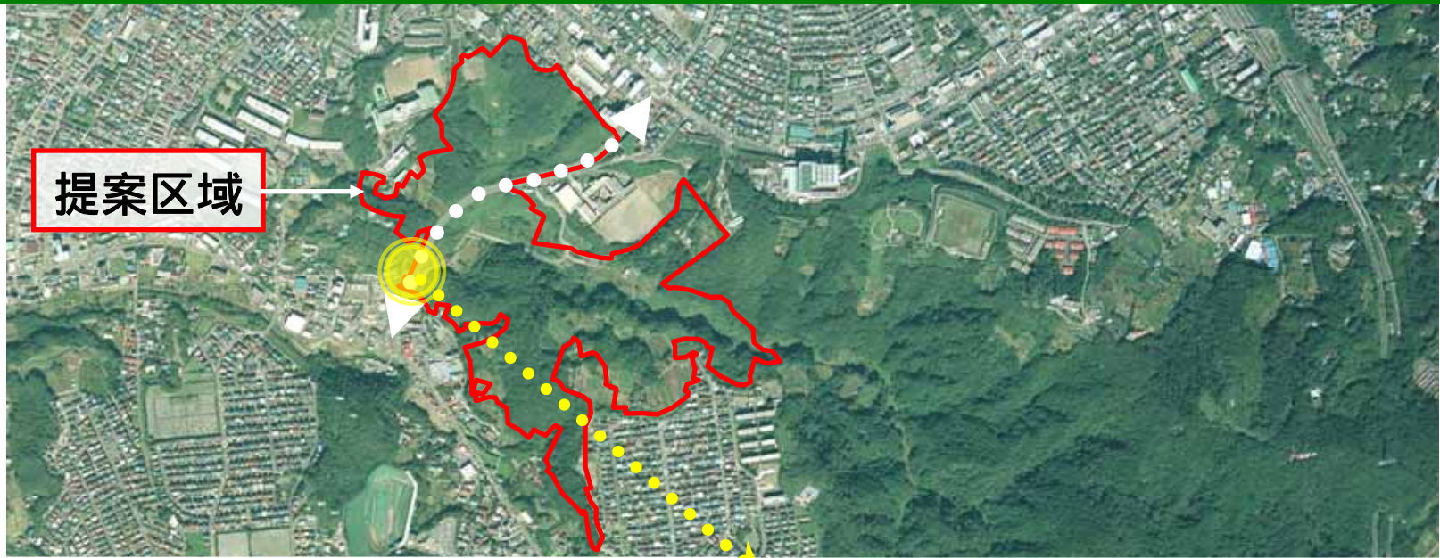
舞岡上郷線2車線暫定供用