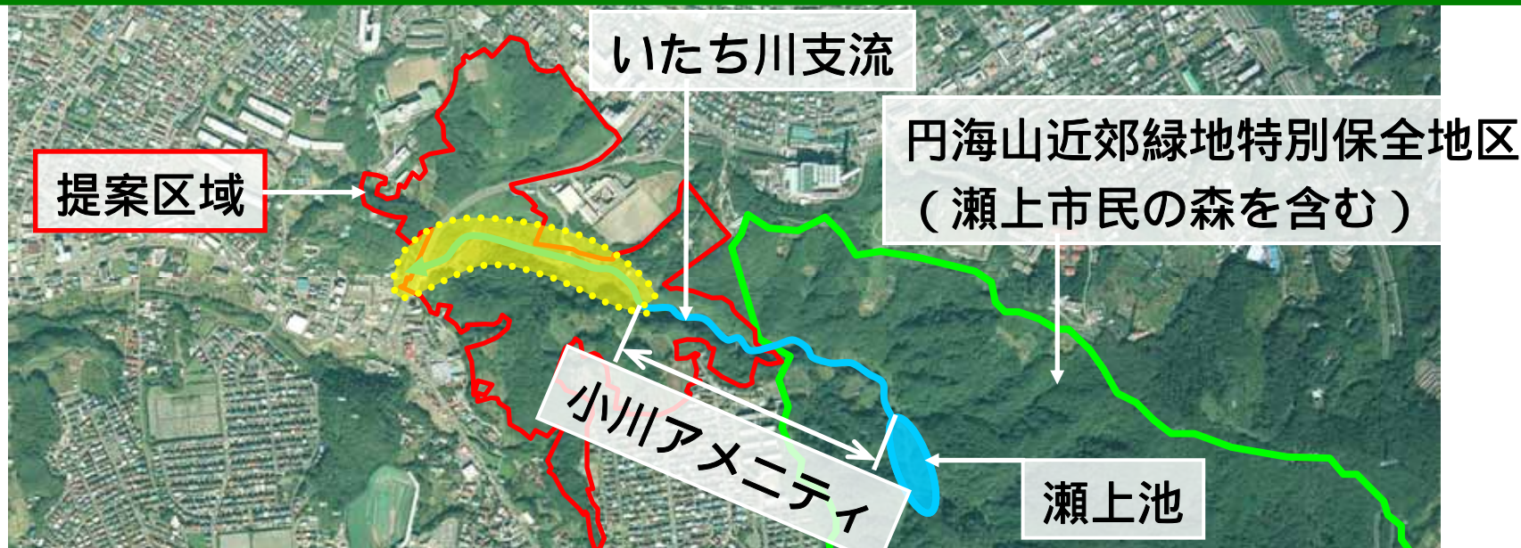
提案区域内水路（下流）