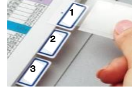
【インデックスのイメージ】