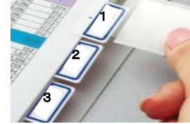
【インデックスのイメージ】