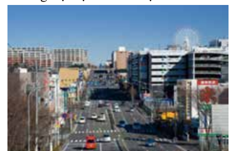
Đường trục tại khu đô thị mới Kohoku