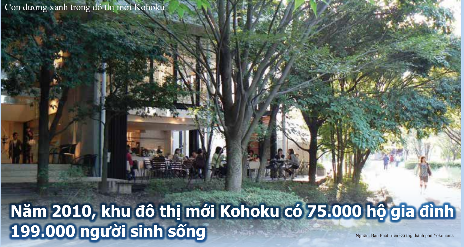
Con đường xanh trong đô thị mới Kohoku

Năm 2010, khu đô thị mới Kohoku có 75.000 hộ gia đình 199.000 người sinh sống