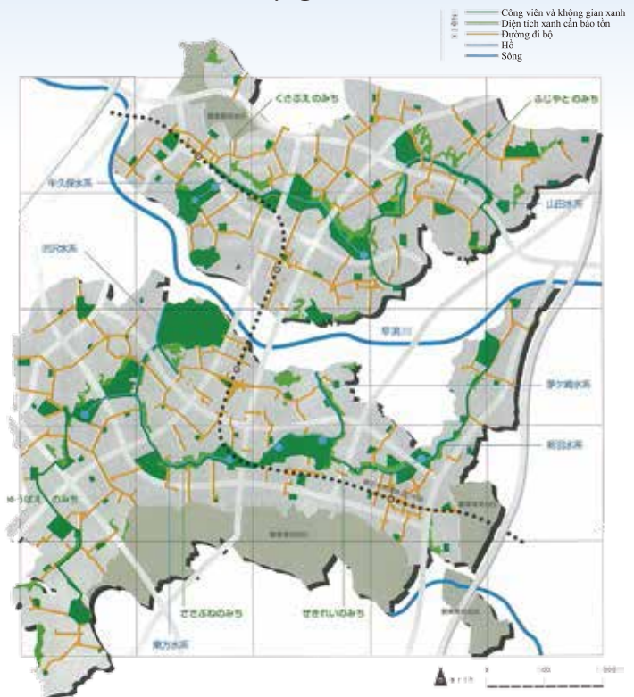
Nguồn: “Mạng lưới xanh tại đô thị mới Kohoku”, Ban Hợp tác Phát triển Đô thị