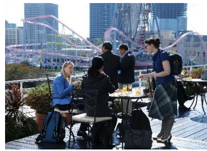
ネットワーキングランチ