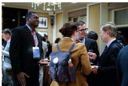
世界銀行主催レセプション

会期を通じて、都市の代表者、ソリューションプロバイダー、国際機関関係者など、会議参加者のネットワーキングを促進する様々なイベントが行われました。