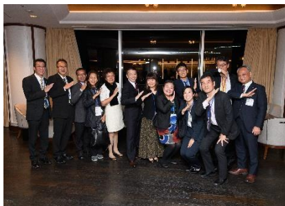
横浜市主催レセプション