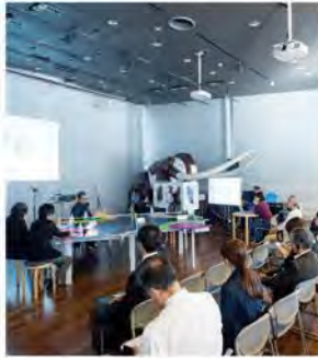
<参考>スマートイルミネーション・サミット2019

象の鼻テラスではKOSUGE1-16の作品展示や、イギリス・香港からゲストを迎えオンライン配信で行うサミットを開催。パークでは、世界と横浜を繋ぐ高橋匡太によるアートプロジェクト「ひかりの実」や、駅・日本大通りと同時多発に展開するスイッチ総研の演劇などを実施します。 ( http://fsp.zounohana.jp/2020/ )