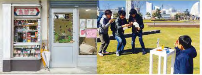
KOSUGE1-16's Kids(駄菓子屋 たはZ)

アートの創造性で公共空間活用を行う「FUTURESCAPE PROJECT」の駅会場として展開。子供も大人も集う交流拠点として、KOSUGE1-16's Kidsによる《駄菓子屋 たはZ》を設置、夜はふらりと立寄れる“スナック”となります。また、9月26~27日には、「スイッチを押すと始まる3秒~30秒の演劇」でお馴染みスイッチ総研の作品も楽しめます。