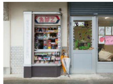
【日本大通り駅】KOSUGE1-16's Kids 《駄菓子屋たばZ》

流れ 14:00～：みなとみらい線 新高島駅改札前 集合（受付 13:45～） Creative Railway について説明 14:10～：各駅を巡りながら、企画コンセプトや背景などを紹介 16:00 頃：「象の鼻テラス」にて解散