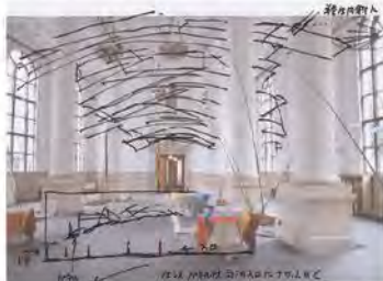
川俣正「BankART Life VI」のためのドローイング

工事中足場単管と仮囲い安全鋼板を用い、1Fホールと外壁ファサード(バルコニー部分)に巨大なインスタレーションを展開します。(http://www.bankart1929.com/)