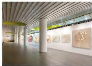
川俣正 ドローイングアーカイブ 参考写真

BankART Stationは、新高島駅改札階 から上がった地下1階にあるアートを スペース。日本を代表するアーティスト川俣正の ドローイング展を開催。BankART Temporary(馬車道駅)で展開している インスタレーションと共通で観覧料は 1,000円。ヨコトリ2020連携チケットでも 観覧可能。(http://www.bankart1929.com/)