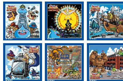
<イベント限定ステッカーイメージ(全6種)>

【実施場所】 ランドマークプラザ/ MARK IS みなとみらい/横浜赤レンガ倉庫/横浜中華街/ 横浜ハンマーヘッド/よこはまコスモワールド/YOKOHAMA AIR CABIN ※対象店舗等の詳細は後日発表させていただきます。