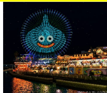
<大観覧車「コスモクロック 21」演出イメージ>