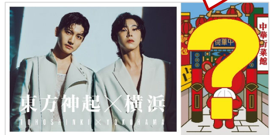
<キャンペーン限定ステッカーイメージ>