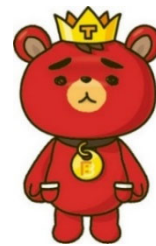
<東方神起ファンクラブ 公式キャラクター「TB」>