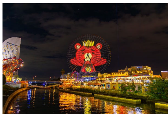
<大観覧車「コスモクロック 21」演出イメージ>