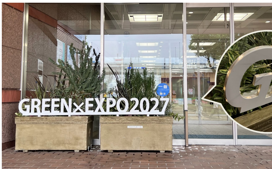
磯子区総合庁舎正面玄関前の植物発電の展示

これまでも磯子区役所では、区内の工業地帯に立地する企業との連携により新たな再生可能エネルギー技術の紹介を行ってきましたが、植物発電の展示を通し脱炭素化の普及啓発につなげます。