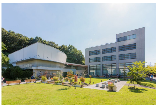
緑園キャンパス中央広場