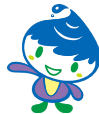
泉区マスコットキャラクター いっずん