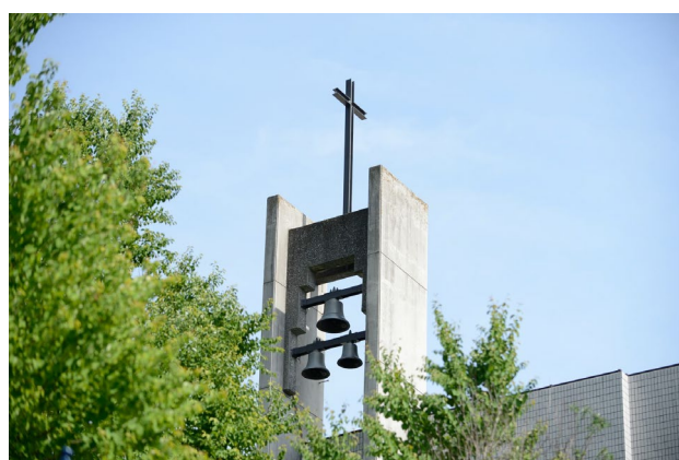
チャペル(カリヨンベル)