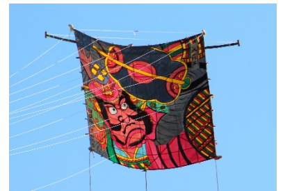
《過去の凧揚げ会の様子》