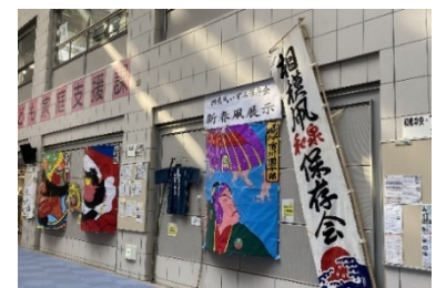
《過去の凧展示の様子》