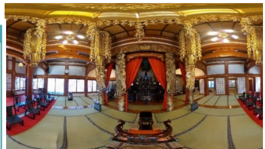
バーチャル体験イメージ（本覺寺の本堂内）