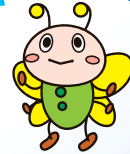
よこはまかんきょうどうろ 横浜市環境行動キャラクター「エコぼん」