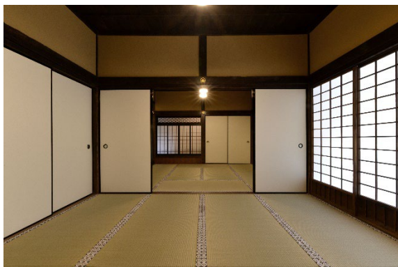
旧円通寺客殿内部の様子