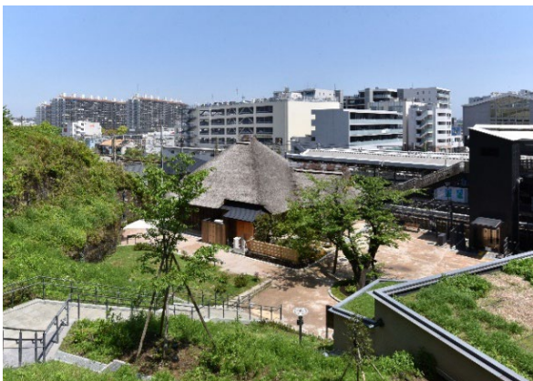
金沢八景権現山公園

施工現場が狭く様々な制約がある現場条件の中、工事業者間等での綿密な調整により、造園と建築の一体的な施工を達成するとともに、景観的・歴史的価値を継承するための様々な配慮と全体的な公園の空間調和などの工夫により、統一感のある園内景観を実現したことが大変高く評価されました。