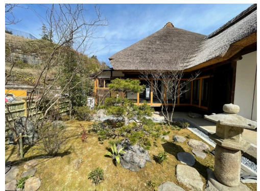
旧円通寺客殿 中庭