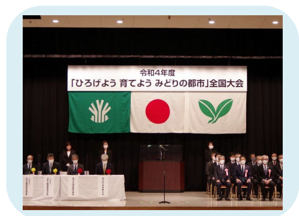
令和4年10月28日（金）に開催された「ひろげよう 育てよう みどりの都市」全国大会において、表彰式が行われました。