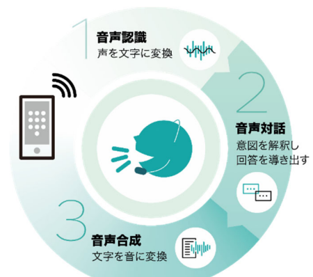
▲AI ロボットの音声技術