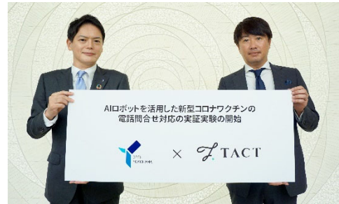
▲左：横浜市 山中市長 右：株式会社 TACT 溝辺代表取締役社長

※1 LGWAN…地方公共団体を相互に接続する行政専用ネットワーク ※2 株式会社 TACT 調べ