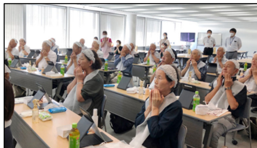
実際のいきいき美容教室の様子