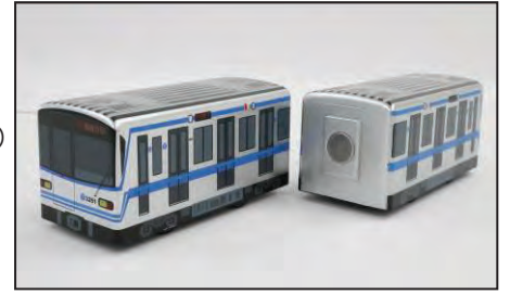
ブルーライン・くつつくトレイン