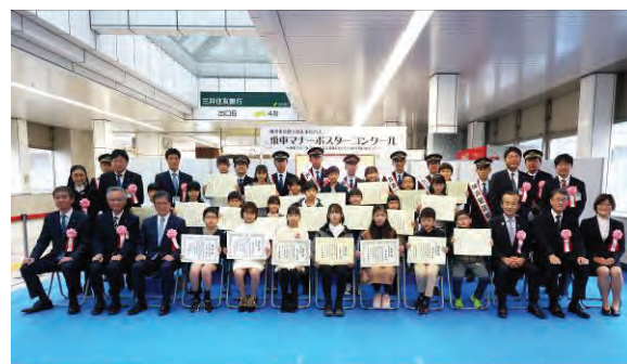
第11回 市営地下鉄&市営バス 乗車マナーポスターコンクール 令和4年11月23日 於 地下鉄センター南駅コンコース 令和4年度 表彰式写真