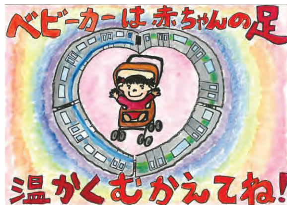
令和4年度 横浜市長賞 受賞作品