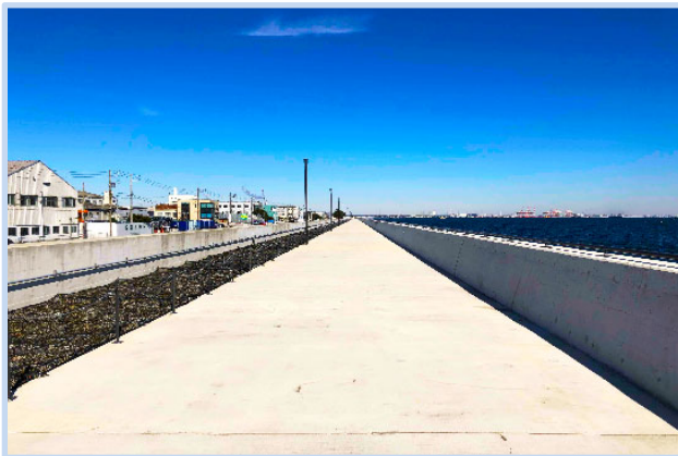
▲延長約1km、幅約5mの遊歩道