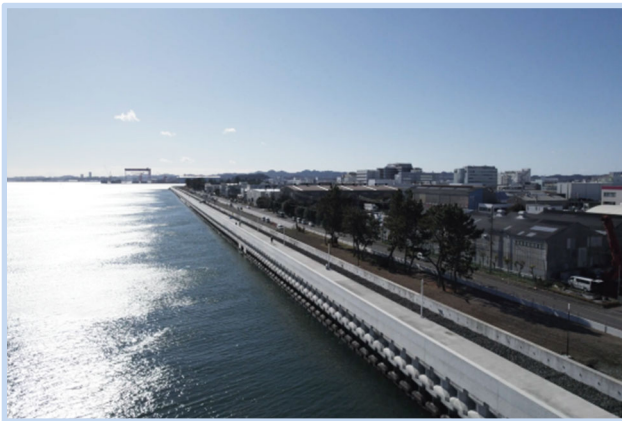
▲散歩道（護岸上部）と緑地