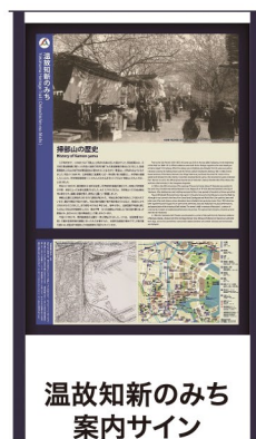
温故知新のみち 案内サイン

*GPSによる位置情報を、許可するに設定してください。 *スマートフォンの利用推奨環境:iOS11.0以降、android7.0以降