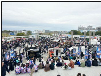
【日産スタジアムでの販売の様子】

本社のある横浜においては、横浜 DeNA ベイスターズ、横浜 F・マリノス、横浜ビー・コルセアーズ、横浜キャノンイーグルスといった横浜を代表するスポーツチームのホームゲームにおけるスタジアムグルメのプロデュースを任せられると共に、横浜市とも横浜産食材を盛り上げる地産地消の取り組みの協定を締結しています。