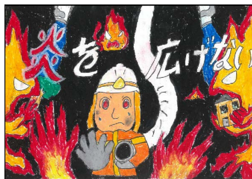
【最優秀 港北火災予防協会会長賞】

なお、最優秀に選ばれた作品は、防火ポスターとして、区内の小学校、保育園、幼稚園、自治会町内会、駅、商業施設等に配布し掲出していただきます。