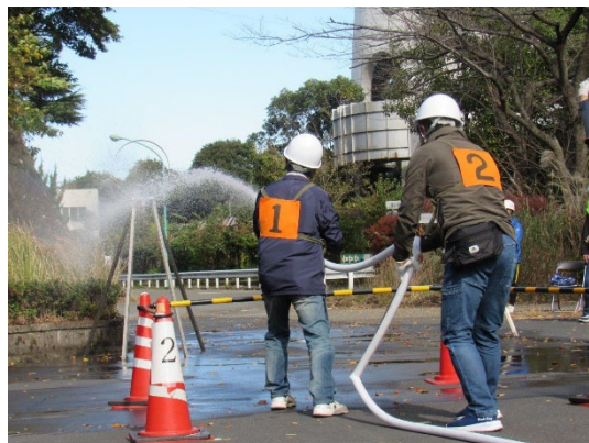
初期消火器具合同訓練会の様子