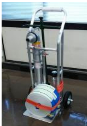
スタンドパイプ式 初期消火器具