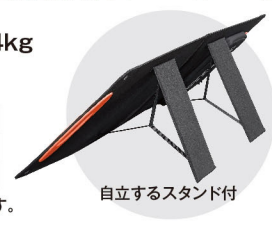
自立するスタンド付