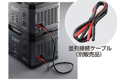
並列接続ケーブル(別販売品)

並列接続ケーブル(別販売品)で2台のポータブル電源を接続、同時に稼働させることにより、出力電力・電池容量がアップします。