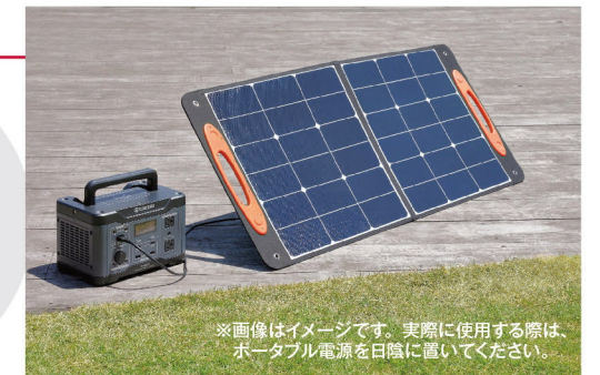
※画像はイメージです。実際に使用する際は、ポータブル電源を日陰に置いてください。