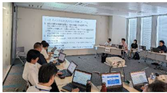
応援隊への活動内容のプレゼンテーション