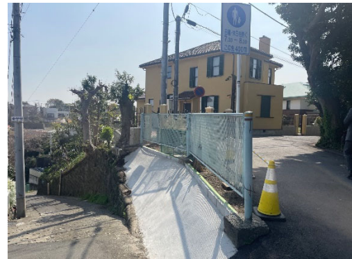
▲山手 133 番ブラフ積み擁壁（左） 山手 133 番館（右）