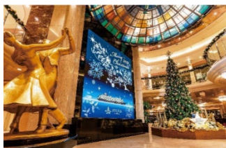
メインデッキ アスカプラザ

世界のクリスマスの名曲とともに圧倒的な歌唱とダンスで繰り広げられるショーやスペシャルステージなど、この時期だけの特別なひとときをお過ごしいただけます。