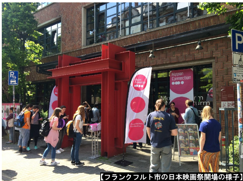
【フランクフルト市の日本映画祭開場の様子】

平成 29 年 6 月 14 日 【発行】横浜市国際局政策総務課 企画担当 045-671-4710 ki-somu@city.yokohama.jp