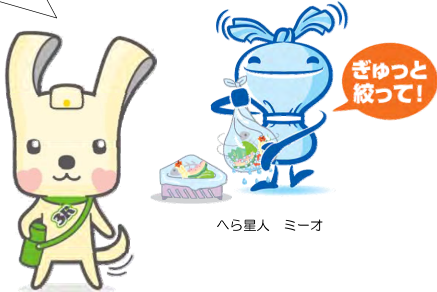
「ヨコハマ スリム 3R夢！」マスコット イーオ

新プランの目標である、総排出量（ごみと資源の総量） ▲10%以上削減と、温室効果ガス排出量▲50%以上削減の 「10」「50」から、「1=イ」・「5=（五つの）イ」と 「0=オ」の組み合わせで「イーオ」だよ！ ミーオと一緒に3RをPRしていくよ。よろしくね！