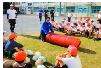
ラグビー選手等による小学校訪問