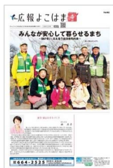
広報よこはま市版4月号

市の基幹的な広報媒体として、毎月1日、「広報よこはま」市版を発行し、市の施策や事業について市民にお知らせします。