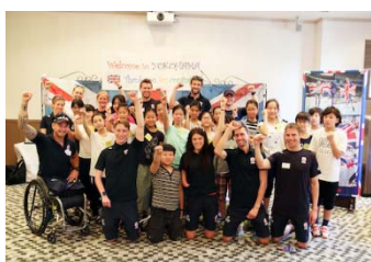
英国トライアスロンチームと 小学生との交流

さらに、大会開催を契機に本市を訪れる高齢者・障害者等のお客様が安全で快適に過ごせる環境を整えるため、バリアフリー化に取り組む市内宿泊施設に対し、改修工事に要する経費の一部を補助します。