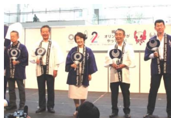
大会 2 年前イベント （クイーンズスクエア横浜）