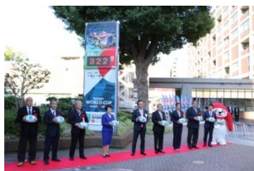
決勝戦 1 年前カウントダウンボード 除幕式（市庁舎前）

※大型スクリーンでの試合放映（パブリックビューイング）、飲食物販売、ラグビーの普及啓発等が行われ、観戦チケットがなくても誰でも気軽に集い、楽しみ、交流できるイベントスペースで、開催都市が設置・運営します。