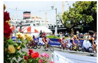
2018ITU世界トライアスロン・ パラトライアスロンシリーズ 横浜大会

令和元年（2019年）で10回目となる「ITU世界トライアスロンシリーズ横浜大会」の開催のほか、大規模スポーツイベントを誘致・開催支援することで、市民が一流選手のプレーを身近で観戦できる機会を増やし、横浜の魅力を発信して、スポーツ振興やシティセールスを図ります。