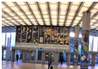
シティドレッシング（新横浜駅）