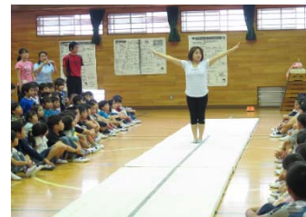
オリンピックによる小学校訪問