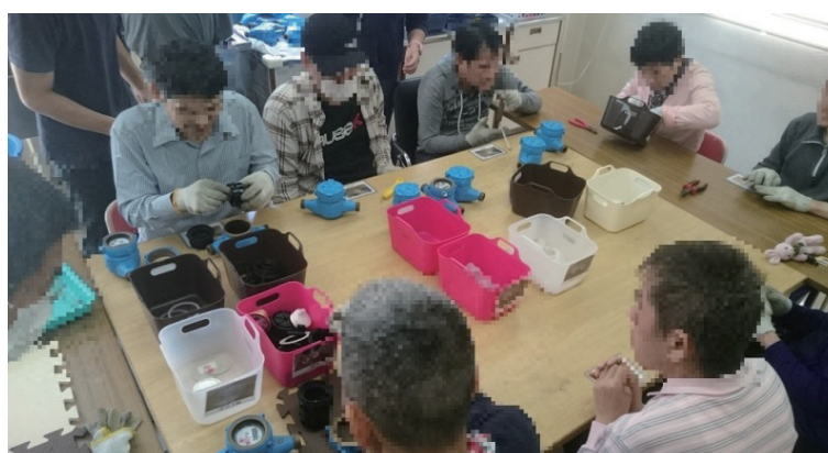
障害者就労施設における水道メーター分解作業の様子