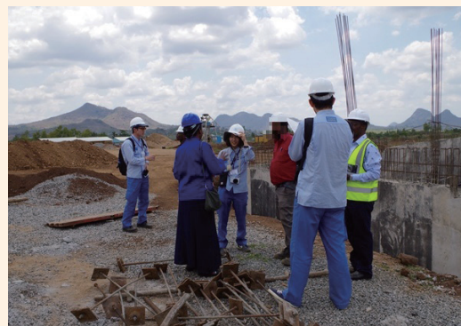
現地での活動の様子(左:ベトナム国フエ省、右:マラウイ国ブランタイヤ市)