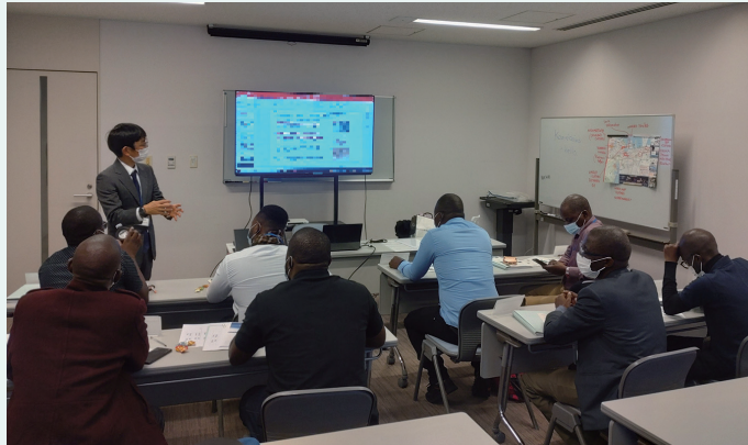
海外水道関係者への会員企業の事業紹介