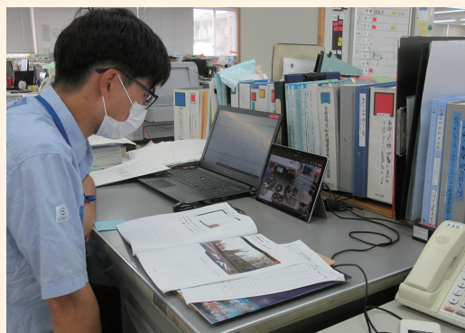
事務所での職員による確認