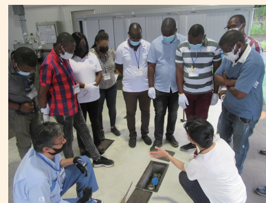
アフリカからの研修員の受入の様子

開催に向けて、アフリカをテーマにした国際活動講演会を実施するほか、会議期間中には浄水場視察ツアーや市内企業へプレゼンテーション機会の提供等を検討するなど、TICAD9開催の機運醸成に取り組みます。