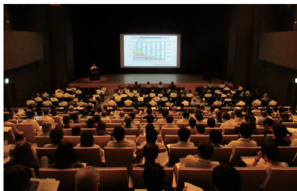
工事安全研修の様子