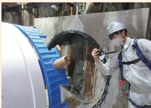
現場での請負事業者による撮影

水道局では、工事現場にいる請負事業者とのビデオ通話によって、職員が現場の状況をリモートで確認する遠隔臨場を実施しています。職員の現場への移動が不要となる他、現場立会の日程調整が容易になるなど、請負事業者・水道局双方の業務効率化につながります。請負事業者が遠隔臨場を導入しやすいよう、必要な機器の導入及び操作についてのハードルを下げるため、普段使用しているスマートフォンを活用することも勧めています。