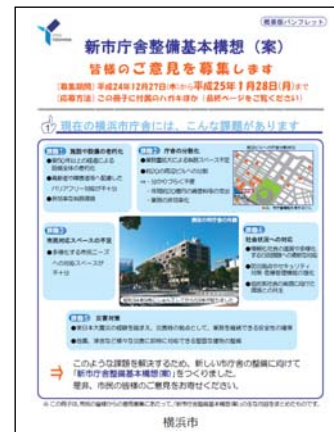
【概要版パンフレット】