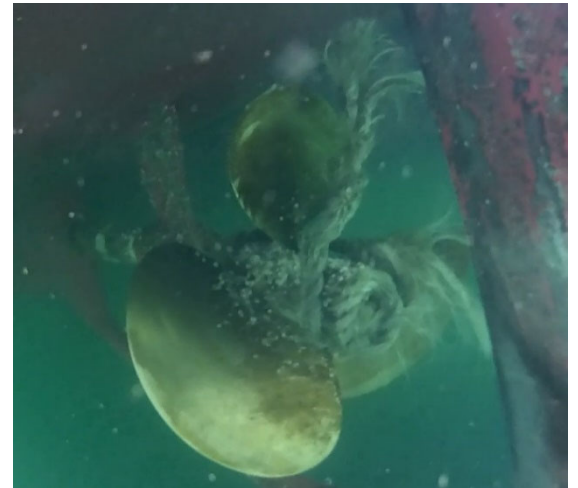
から ふね ロープが絡まった船のプロペラ

よこはまこう うみ まも 横浜港のきれいな海を守ることはもちろん ですが、ふね きけん りゅうぼく 船にとって危険な流木やロープなど のごみを回収することで、かいしゅう ふね しょうとつ 船との衝突や、プ ロペラに絡まる事故を防ぐなど、ふね あんぜん 船の安全な ゆき たいせつ しごと 行き来のための大切な仕事です。