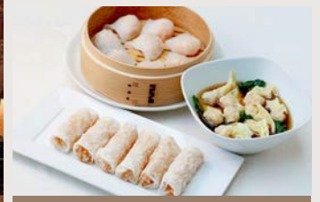
海老プリプリ手作り点心セット(3種23個)