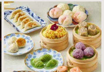
得々飲茶セット(10種32個入り)