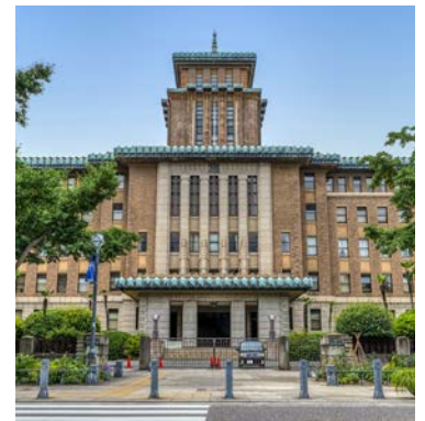
神奈川県庁 (キングの塔)