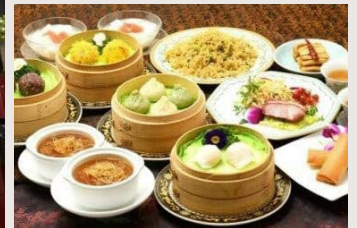
飲茶ランチコースペアご招待券