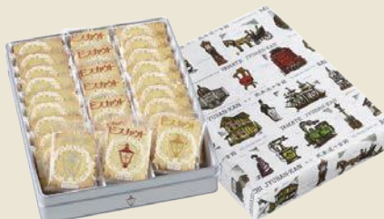
【馬車道十番館】ビスカウト