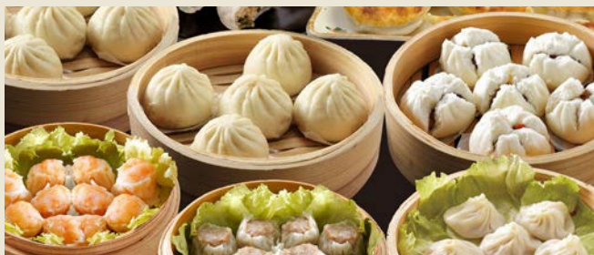
【横浜中華街中国料理世界チャンピオン皇朝】中華点心詰合せC(7種 計61個)