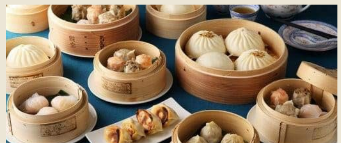
【萬珍樓】中華饅頭・点心セット(10種)〈萬珍食品〉