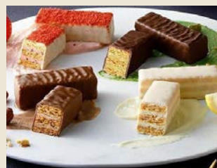
【フランセ】 果実をたのしむミルフィユ