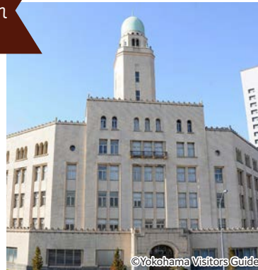
横浜税関 (クイーンの塔)