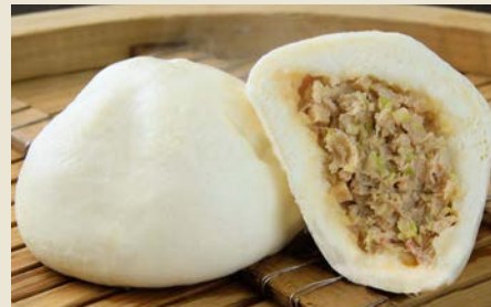
【横浜中華街 江戸清】 ブタまんセット(10個)