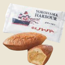
【ありあけ】 横浜ハーバー ダブルマロン