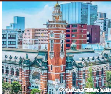
横浜市開港記念会館 (ジャックの塔)

横浜の歴史的建造物「横濱三塔」キング、ジャック、クイーンの愛称で親しまれている、塔を備えた横浜の歴史的建造物が建ち並びます。