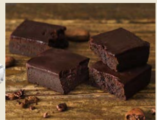
【横浜元町霧笛楼】 横浜煉瓦(フォンダンショコラ)