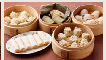
本格飲茶手作り点心セット(5種33個)