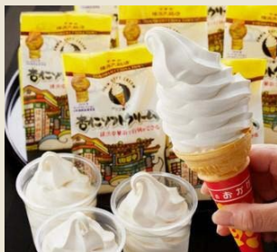
【横浜大飯店】 杏仁ソフトクリーム 10個入り