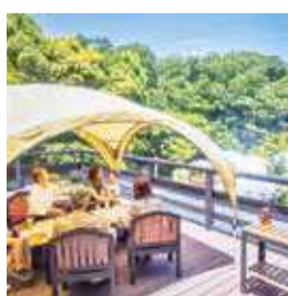
ハンズパオ横浜グランピング バーベキュー招待券