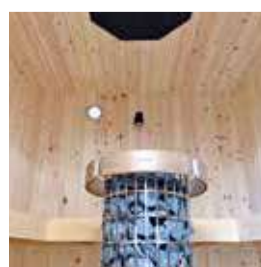
ハブ ハブ HUBHUB横浜天王町 貸切サウナ招待券 など