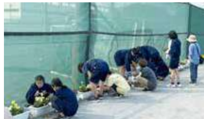
地域の人とともに植栽する生徒たち