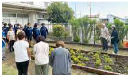
地域の人・PTA・生徒たちが花への想いを共有しました