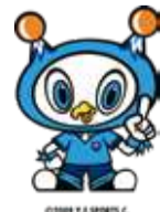
横浜FC オフィシャル クラブマスコット 「フリ丸」

保土ヶ谷区ブースで500円以上 購入して、プレゼントが 当たる抽選会に参加しよう!