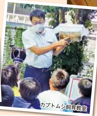
カブトムシ飼育教室