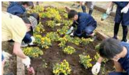
学校の花壇に植栽する生徒たち