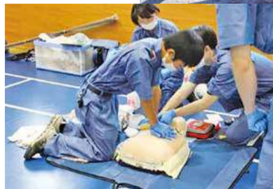
応急手当指導員による 救命講習