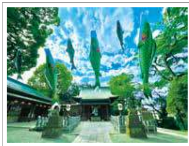
新緑の季節の星川杉山神社