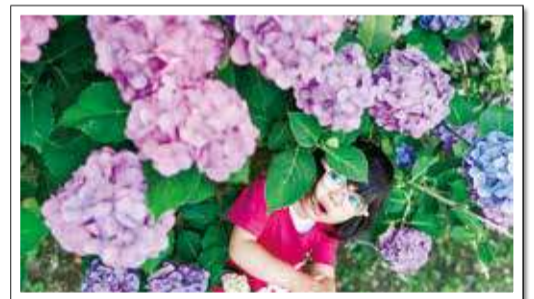
天王町公園でかくれんぼ