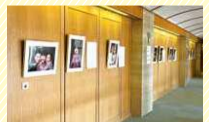
かながわアートホールでの写真展

「障害のある子どもとその家族が暮らしていくためには困難なことが多く、特に障害のある子どもの将来の行き場不足や家族に対するサポートの不足が課題であると感じています。まずはみんなが集まれる写真館を作り、障害のある子どもとその家族の居場所となり、相談の場や一緒に支え合える場にしていきたいことが今後の目標です」とすてきな笑顔で語ってくれました。