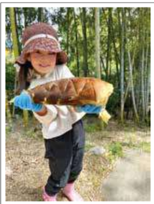
川島町でたけのこ掘り