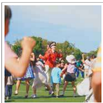
保土ヶ谷公園での区民まつり

※応募された全写真(1,150作品)は、Instagramにて「#フォトガヤ2024」で検索すると見ることができます。