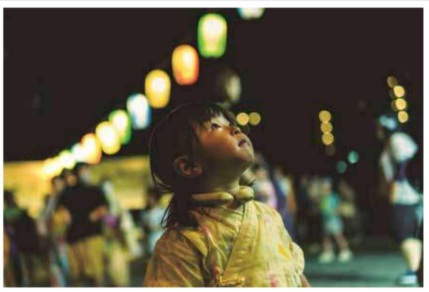
西久保町公園の盆踊り大会