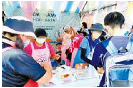
区民まつりでの啓発活動