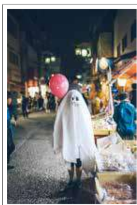
松原商店街 ナイトバザールにて