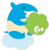
横浜市脱炭素応援 キャラクター 「パクパク」

「YOKOHAMA GO GREEN」は、2050年の脱炭素社会の実現に向け、市と市民・事業者が一丸となって、環境にやさしい行動を進めるための合言葉です。生活の中で、できることから「GO GREEN」を始めてみましょう!