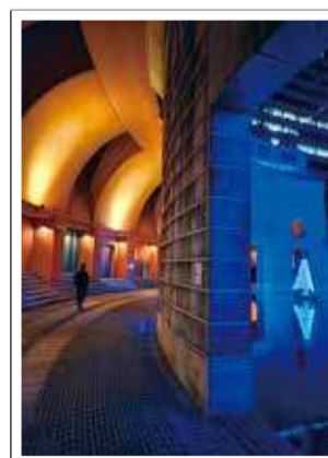
横浜ビジネスパーク ベリーニの丘