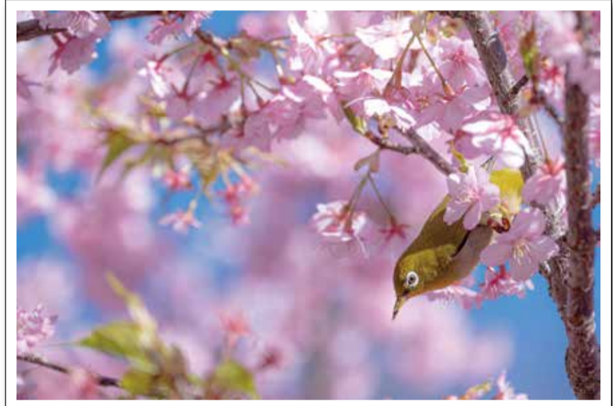
早春の保土ヶ谷公園

●ほ도가や花憲章 「花と緑にあふれ、清潔で美しい街づくり」をすすめるため、1998年に制定しました。