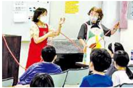
放課後キッズクラブでの食育授業