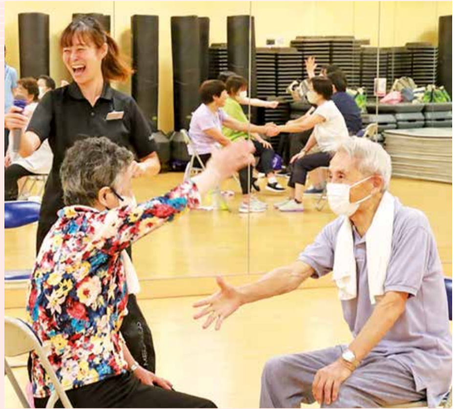
楽しく脳を活性化!