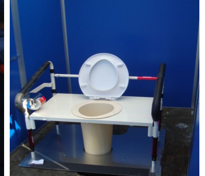
「防災資機材取扱訓練を開催」