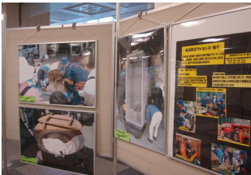
「年2回 防災パネル展の開催」