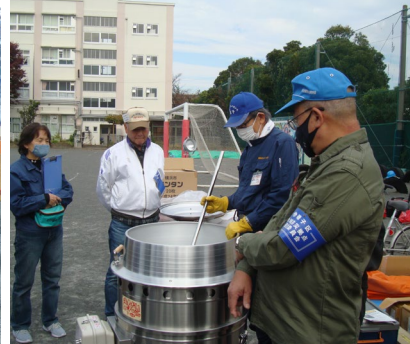
「拠点防災備蓄庫の点検」