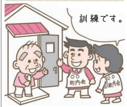
安否確認訪問訓練