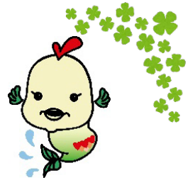
磯子区社会福祉協議会イメージキャラクター ふくちゃん

ボランティア活動や講座のご案内等、様々な情報をお届けします。 また、ボランティア登録や活動の申し込みも LINE からできます。 二次元コードを読み取るか、ID (@517cugon) を検索していた だき、友達追加をお願いします。