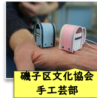
磯子区文化協会 手工芸部