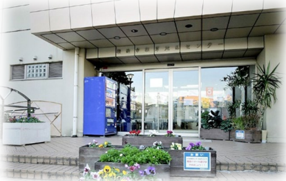
根岸地区センター

サークル活動、研修会、スポーツ、趣味を通して仲間づくりの場として気軽にご利用いただける施設です。