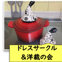
ドレスサークル & 洋裁の会