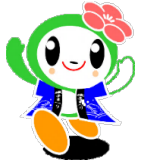
磯子区マスコットキャラクター「いそっぴ」