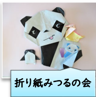
折り紙みつるの会