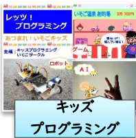
キッズプログラミング