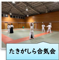
たきがしら合気会