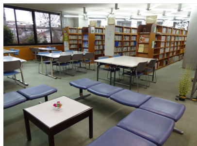
上中里地区センターロビー

『明るく元気な地区センター』をモットーに、地域の皆さまが自主的に活動し、スポーツ・レクリエーション・クラブ活動等を通じて相互の交流を深めることができる施設です。