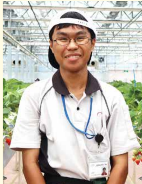
仕事:イチゴ栽培、施設清掃、受付案内 好きなこと:ももいろクローバーZのコンサートに行くこと

ずっと立ち仕事であり、害虫駆除のためカッパを着て作業するときは暑くて大変です。それでも、グループみんなで声をかけあって仕事をするのにやりがいを感じます。毎朝交通情報を確認し、仕事に遅れないよう気をつけています。母に給与明細を見せたときに「頑張ったね」と言われたのがうれしかったです。