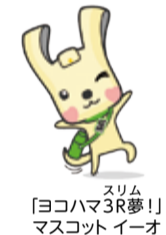
スリム「ヨコハマ3R夢!」マスコット イーオ