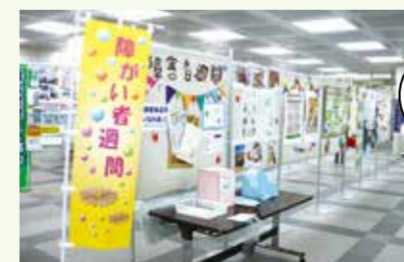
区内障害者団体による活動紹介パネル