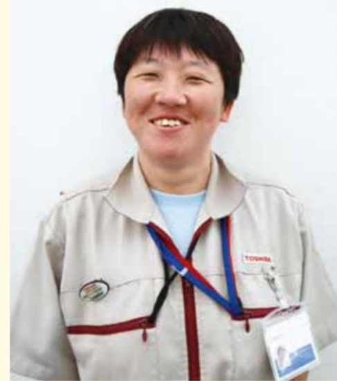
仕事:グループ会社内の清掃、見学者案内、業務報告書の作成、物品発注、他メンバーのフォロー 好きなこと:ディズニーランドなどへの外出

この特集に関する問合せ: 高齢・障害支援課 ☎750-2416 fax750-2540