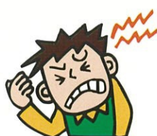
いたい I feel pain