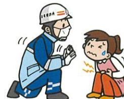
すこし待ってください Please wait for a moment