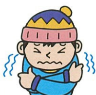
さむい I feel cold