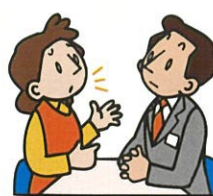
そらだん 相談したい I'd like a consultaion