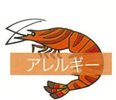
アレルギー shrimp allergy