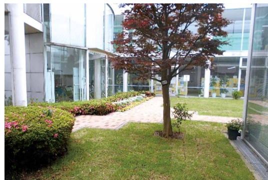
下和泉地域ケアプラザの中庭

また、介護保険の相談対応や地域のサロンに出向いての出張講座など、各活動団体へのサポートも行っています。「いつも ず〜っと みんながぼかぼか ~ちょっと寄りたくなるプラザ~」のスローガンのもと、皆さんの来館をお待ちしています。