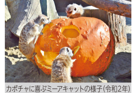
カボチャに喜ぶミーアキョットの様子(令和2年)