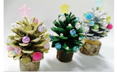
昨年の工作教室で製作したクリスマスツリー 問 よこはま動物園ズーラシア ☎959-1000 ☎959-1450 ズーラシア 検索