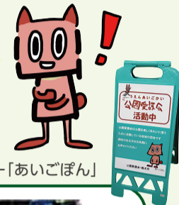
横浜市公園愛護会 マスコットキャラクター「あいごぼん」