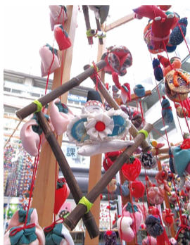
昨年の展示の様子

こどもの健やかな成長を願って飾る、手作りのつるし飾り展 2月14日(月)12時~19日(土)12時 区役所1階区民ホール 区民事業担当(3階309窓口) ☎800-2392 📠800-2507