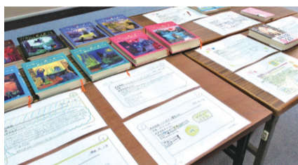
令和5年1月開催の様子