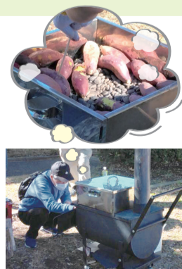
薪ストーブを活用した焼き芋