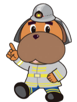
横浜市消防局マスコットキャラクター ハマくん

「ポケモンぼうさいきょうしつクイズ」もあるよ! クイズに挑戦してポケモンの修了証をゲットしよう!